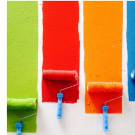
Action & Expression